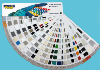
コンパクトな短冊形見本帳