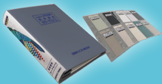
粉体塗料を実際に塗装した塗板を収録