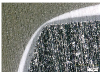
エッジプライマーECO+粉体塗料