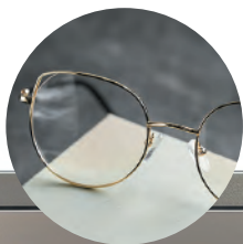
メガネフレーム ・宝飾品