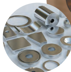
一般工業用製品 ・OA機器等